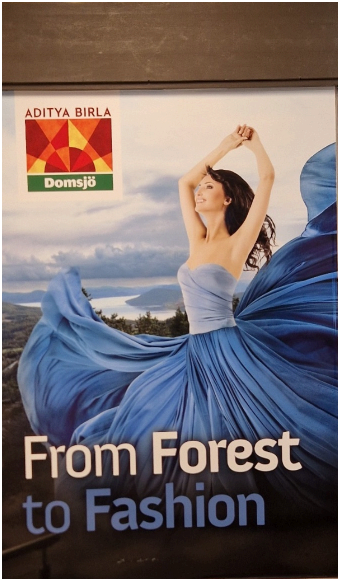
Exponering på Örnsköldsvik Airport